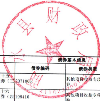
2022年--2023年末411623 商水县发行的新增地方政府专项债券情况表