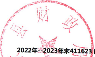
2022年--2023年末411623 商水县发行的新增地方政府一般债券资金收支情况表