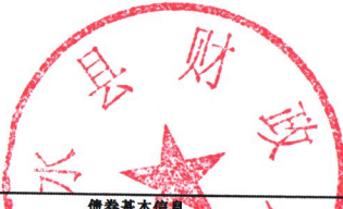
2022年--2023年末411623 商水县发行的新增地方政府专项债券情况表